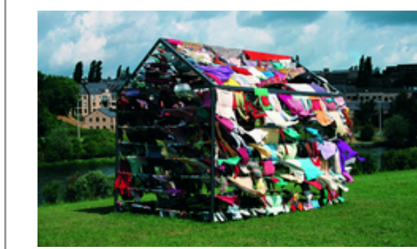
28 September 2013 - 13 October 2013. Het Cultuurcentrum De Ververij Ronse stippelde een uitdagend kunstenparcours uit doorhe