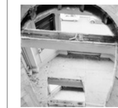
02 May 2021 - 29 August 2021. De Vlaamse museumwereld blijft in beweging, maar de berichtgeving in de media omtrent deze vernieuwinger