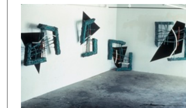
Het ICC zou op verschillende wijzen een belangrijke formerende rol hebben voor het collectiepotentieel. Flor Bex ambieerde een museale func